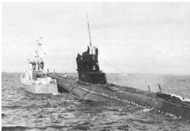
Natten till den 28 oktober 1981 gick den sovjetiska ubåten U 137 på grund vid Torumskär i inloppet till Gåsefjärden nära Karlskrona örlogsbas.

För att fortsätta spaningen efter den generalinje som jag menar finns i den svenska sovjetpolitiken kan noteras att ännu så sent som 1991 utrikesminister Sten Andersson torgför uppfattningen att ”Estland inte är