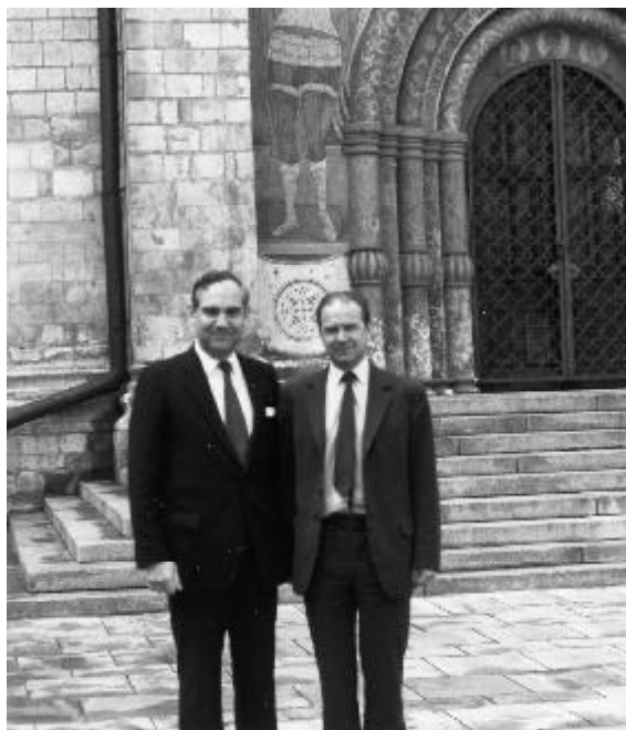
Ambassadörerna Theutenberg och Rybakov i Kreml vid östersjöförhandlingarna i Moskva den 17–19 juni 1985.

Efter hand inledde vi en personlig dialog om möjligheten att lösa den utestående gränsdragningsfrågan öster om Gotland, den s k gråzonen. Det såg mörkt ut från början, eftersom utgångsläget var att Sovjetunionen ansåg sig ha rätten till minst 75 % av det omtvistade området, varvid Sverige således endast skulle erhålla återstående 25 %. Rybakov och jag träffades i januari 1985 på Scott Amundsen-basen