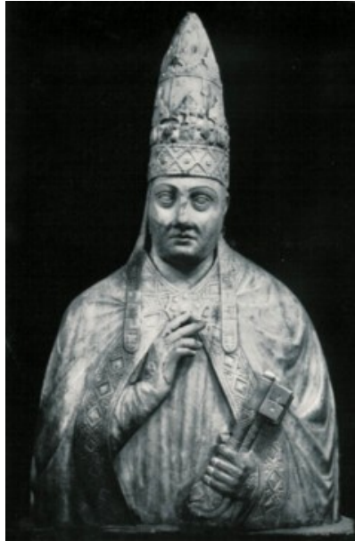
Bild 1. Påven Bonifatius VIII:s bulla den 18 november 1302 Unam Sanctam , genom vilken påven hävdade total överhöghet över varje människa, även de världsliga furstarna. Nyckelorden lyder: Declaratio quod subesse Romano pontifici est omni humane creature de necessitate... Därför förklarar vi, fastslår, definierar och uttalar att det är alltigenom nödvändigt för varje mänsklig varelses frälsning att underkasta sig den romerske påven.