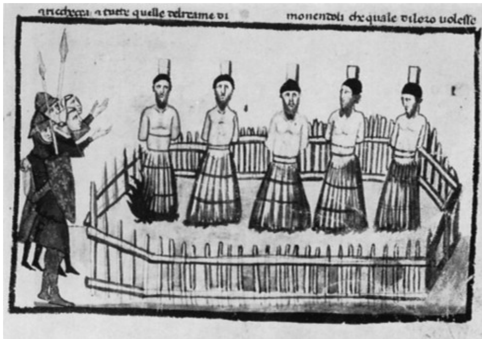
Bild 3. Många tempelriddare brändes på bål för de gärningar de tvingats bekänna under tortyr. På Filip den skönes order brändes ordens stormästare Jacques de Molay den 18 mars 1314 på bål på ön Ile-de-Javiaux i Seine.

I bullan Vox in Excelso förklarades Tempelherreorden upplöst genom ett oåterkalleligt och evigt gällande dekret. Orden förklarades av påven, med samtycke av det Heliga konciliet, olaglig för all framtid. "Vi förbjuder alla och envar att i framtiden inträda i denna orden, att ta emot eller bära dess dräkt och att uppträda som en tempelbroder.