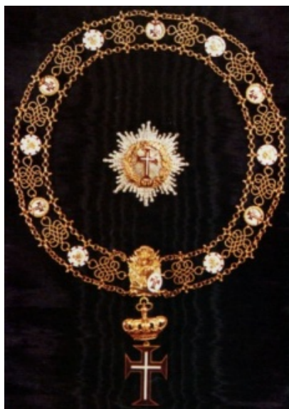
Bild 4. Bilden visar halskedja med kors av den påvliga Kristusorden (The Supreme Order of Christ eller Militia Domini Nostrī Iesu Christi ). Denna påvliga förtjänstorden – den högsta som finns och som är förbehållen katolska statsöverhuvuden – har gemensamma rötter med den av den portugisiska kungen Dionysius I den 14 augusti 1318 instiftade Kristusorden, vilken konfirmerades av påven Johannes XII år 1319. Syftet med den nya portugisiska Kristusorden var att densamma skulle överta den viktiga militära roll som den 1314 av påven Klemens V upplösta Tempelriddarorden hade spelat i Portugals försvar mot morerna. Kristusorden kan sägas vara den enda och mest legitima efterföljaren till den förintade och för all framtid förbjudna Tempelherreorden. Ordenskorset har influerats av Tempelriddarnas kors. Bilden: Peter Bander van Duren, Orders of Knighthood and of Merit , s 64 ff.

Efter att påven Gregorius XI (1370 – 1378) år 1377 hade tvingats återvända till de kaotiska förhållandena i Kyrkostaten och i Rom – här till uppmanad av den Heliga Birgitta – vidtog efter dennes död den Stora Schismen (1378 – 1417) inom kyrkan, med en påve sittande i Avignon och en annan i Rom. Denna period förebådade påvedömetts nedgång och förfall under 1400-talet (Pius II, 1458 – 1464; Sixtus IV, 1471 – 1484, Innocentius VIII, 1484 – 1492) och Alexander VI Borgia, 1492 – 1503).